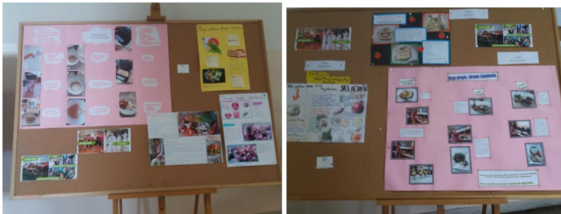
13. Zajęcia kulinarne – robienie sałatek owocowo-warzywnych na lekcjach wychowawczych, technice, innych lekcjach.