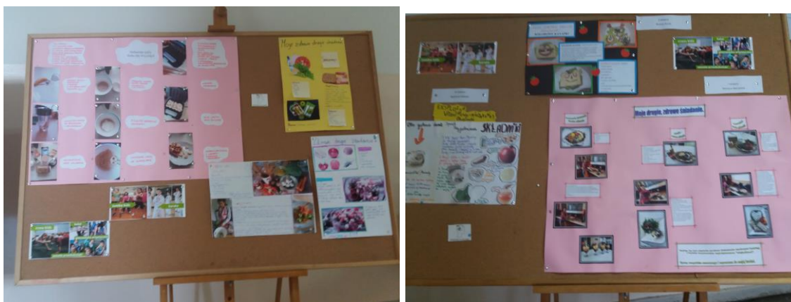
13. Zajęcia kulinarne – robienie sałatek owocowo-warzywnych na lekcjach wychowawczych, technice, innych lekcjach.